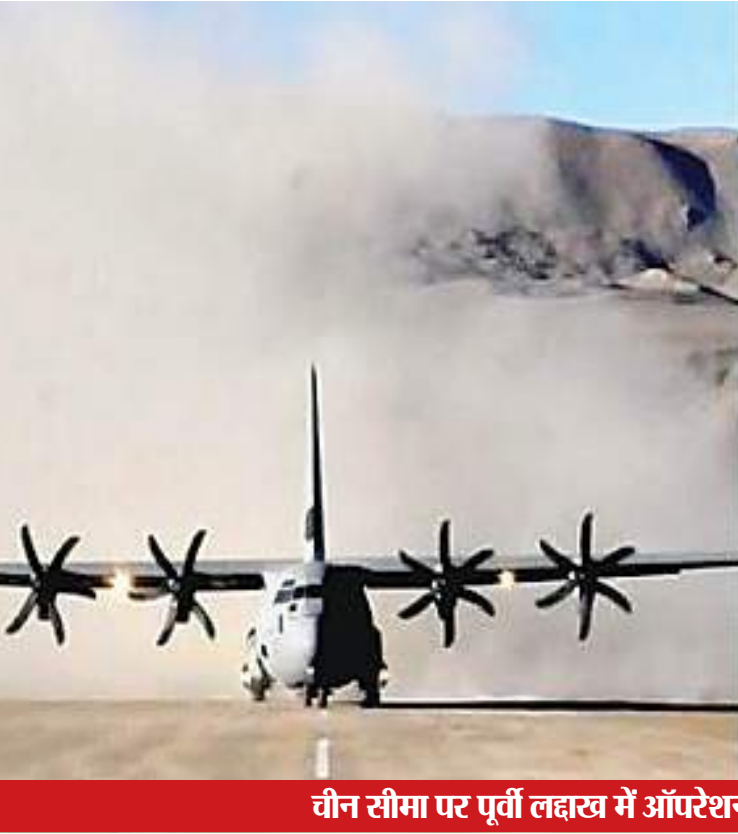
चीन सीमा पर पूर्वी लद्दाख में ऑपरेशनल हुआ दुनिया का सबसे ऊंचा हवाई अड्डा