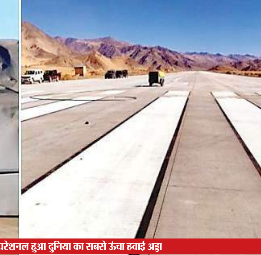
चीन सीमा पर पूर्वी लद्दाख में ऑपरेशनल हुआ दुनिया का सबसे ऊंचा हवाई अड्डा

संग्राम सेनानियों की लगभग 650 मूर्तियां लगाई गई हैं. प्रथम गैलरी में छत्तीसगढ़ की जनजातीय जीवन शैली को दर्शाया जाएगा, वहीं दूसरी गैलरी में राज्य की जनजातियों पर अंग्रेजों और स्थानीय हुकूमत के अत्याचार, तीसरी गैलरी में हल्बा विद्रोह, चौथी गैलरी में सरगुजा विद्रोह, पांचवीं गैलरी में भोपालपट्टनम विद्रोह, छठवीं गैलरी में परलकोट विद्रोह, सातवीं गैलरी में तारपुर विद्रोह, आठवीं गैलरी में लिंगगिरी विद्रोह, नौवीं गैलरी में कोई विद्रोह के दृश्य होंगे. इसी प्रकार दसवीं गैलरी में दंतेवाड़ा क्षेत्र में मेरिया विद्रोह, ग्यारवीं गैलरी में मुरिया विद्रोह, बारहवीं गैलरी में रानी चौरिस विद्रोह, तेरहवीं गैलरी में बस्तर के भूमकाल विद्रोह, चौदहवीं गैलरी में शहीद वीर नारायण सिंह के सोनाखान विद्रोह एवं पंद्रहवीं गैलरी में झण्डा सत्याग्रह एवं जंगल सत्याग्रह के वीर आदिवासी नायकों के संघर्ष को बखूबी चित्रण किया जा रहा है. छत्तीसगढ़ के मुख्यमंत्री विष्णु देव साय ने कहा कि 1 लगे अत्याधुनिक