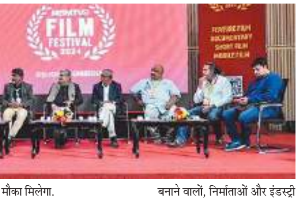
शुभम संदेश। रांची

मौका मिलेगा. 300 से ज्यादा फिल्मकार एक छत के नीचे आएंगे : इस बार फेस्टिवल में 300 से अधिक फिल्मकारों और 2,000 से ज्यादा फिल्म प्रेमियों के शामिल होने की उम्मीद है. यह आयोजन फिल्म