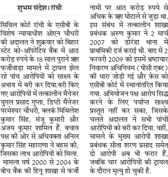
शुभम संदेश। रांची