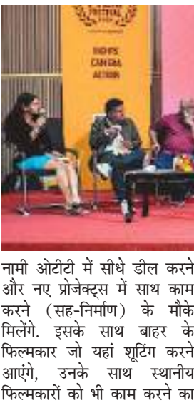
शुभम संदेश। रांची