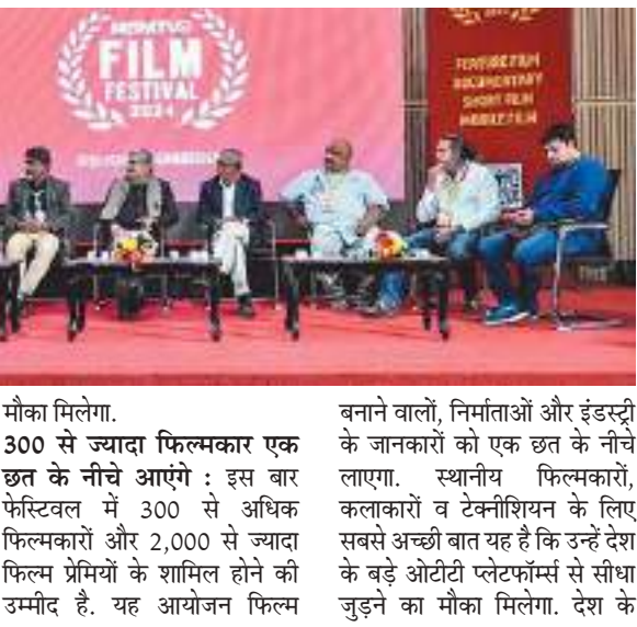
शुभम संदेश। रांची