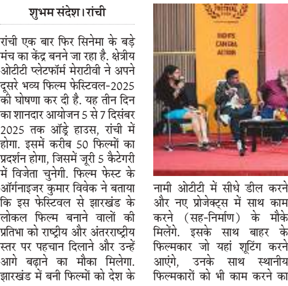
शुभम संदेश। रांची

300 से ज्यादा फिल्मकार-टेक्नीशियन होंगे शामिल, एआई से बनी फिल्मों के बीच भी होगा कंपीटिशन