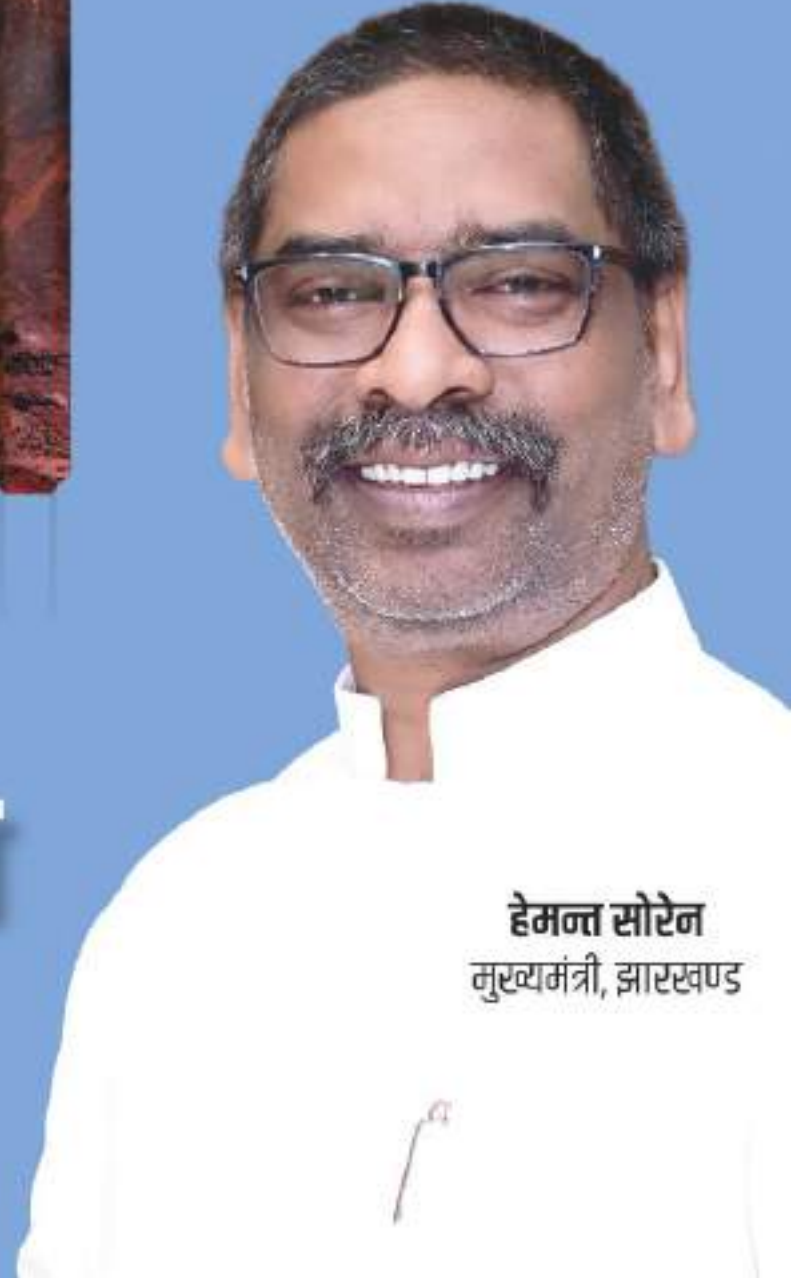
हेमन्त सोरेन मुख्यमंत्री, झारखण्ड