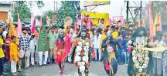
शुभम संदेश। झरिया

प्रसिद्ध मां दुखहरणी धाम प्रांगण में मां दुखहरणी धाम सेवा समिति के तत्वाधान में सात दिवसीय श्रीमद्भागवत कथा का आयोजन शुरू हुआ. कार्यक्रम के उद्घाटन पर सुबह 11 बजे भव्य कलश यात्रा निकाली गई, जिसमें करीब 1100 महिला-पुरुष श्रद्धालु शामिल हुए. यात्रा मंदिर प्रांगण से प्रारंभ होकर मुख्य मार्गों से होते हुए ऊपर कुली तक पहुंची और