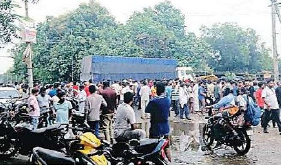
शुभम संदेश। बोकारो

गावां प्रखंड के सेरुआ सिमर स्थित रेहा रोड से बेंन्डो नदी तक बन रही सड़क के घटिया निर्माण को लेकर ग्रामीणों ने विरोध प्रदर्शन किया। यह सड़क मुख्यमंत्री ग्राम सड़क सुदुर्धिकरण योजना के तहत ग्रामीण कार्य विभाग, गिरिडीह की देखरेख में बन रही है। ग्रामीणों ने आरोप लगाया कि सड़क का काम पूरा होने से पहले ही गार्डवॉल और सड़क जगह-जगह से टूटने लगी है। उनका कहना है कि निर्माण कार्य में निष्पक्षित माफपट्टे की अनदेखी की जा रही है।