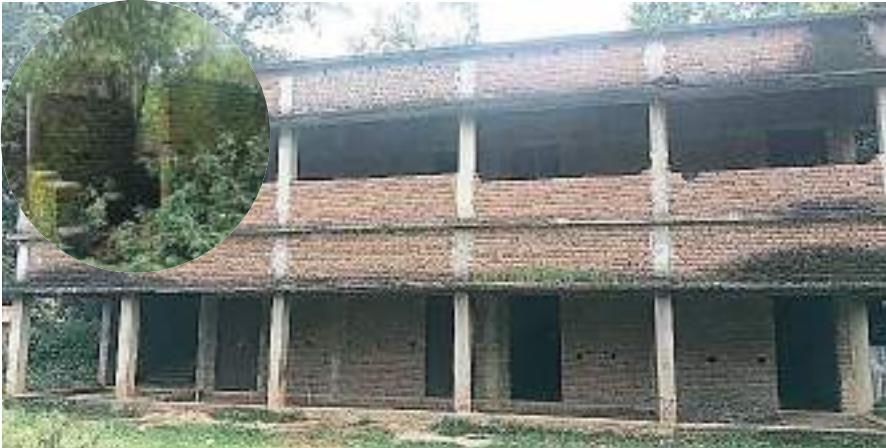
शुभम संदेश। गावां (गिरिडीह) गावां प्रखंड स्थित जमडार पंचायत के उल्लंघित मध्य विद्यालय भगइवा में

भवन निर्माण के लिए आवंटित 21,40,302 रुपये की राशि भवन अधूरा रहते ही निकाल ली गई। आज भी विद्यालय का भवन आधा-अधूरा पड़ा