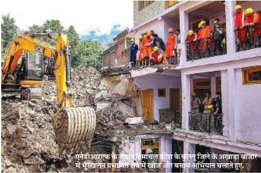
एनईडीआरएफ के जवान मिमाचल प्रदेश के कुलसु जिले के अखाड़ा बाजार में भूस्खलन प्रभावित क्षेत्र में खोज और बचाव अभियान चलाते हुए

इसके अलावा, ईद-ए-मिलादुन्नबी के अवसर पर शनिवार सुबह जश्न जुलूस के लिए ढाका में